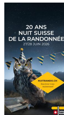
JPG, FORMAT 1080 X 1920 AVEC ACCROCHE