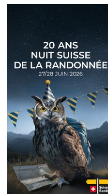
JPG, FORMAT 1080 X 1920