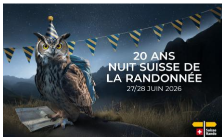
JPG, FORMAT 1500 X 927