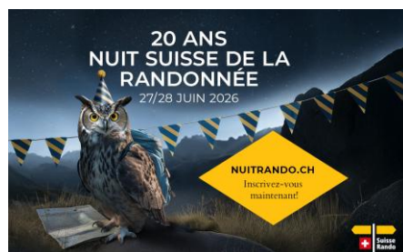
JPG, FORMAT 1500 X 927 AVEC ACCROCHE