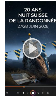
VIDÉO (ANIMATION) FORMAT MP4 9:16