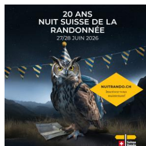
JPG, FORMAT 1080 X 1080 AVEC ACCROCHE