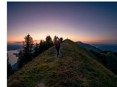
1 IMAGE D'AMBIANCE