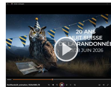
VIDÉO (ANIMATION) FORMAT MP4 16:9