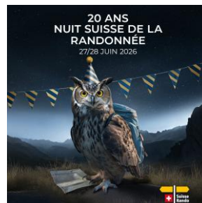
JPG, FORMAT 1080 X 1080